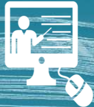
SESIONES POR STREAMING